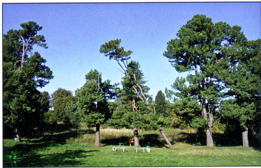
Кедры в парке

132. Выпово , 20 км от г. Суздаля (Владимирский у.). Усадьба колл. сов. Е.Д. Языковой известна в последней четверти XVIII в.; в первой половине и середине XIX в. принадлежала штаб-ротмистру кн. Д.Е. Вяземскому; во второй половине столетия владели его дети флигель-адъютант кн. Л.Д. Вяземский (1848-1909), женатый на гр. М.В. Левашовой, и его сестра кнж. Л.Д. Вяземская (р. 1850).